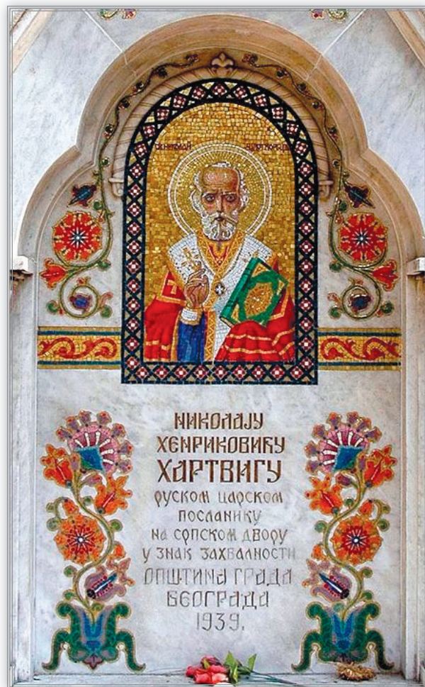
Часовня над могилой Н. Г. Гартвига на Новом кладбище в Белграде, воздвигнутая на деньги правительства страны и добровольные пожертвования русским архитектором Г. П. Ковалевским