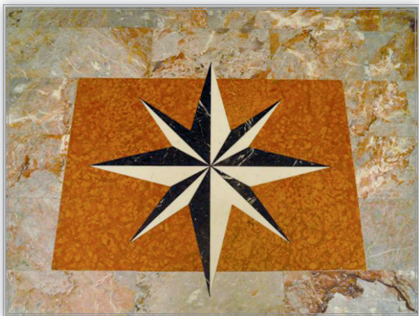
В вестибюле здания Белградской католической епархии на полу выложена вот такая звезда...

Ах, какой удар судьбы! И зачем он не родился девочкой! — воскликнула несчастная мать.