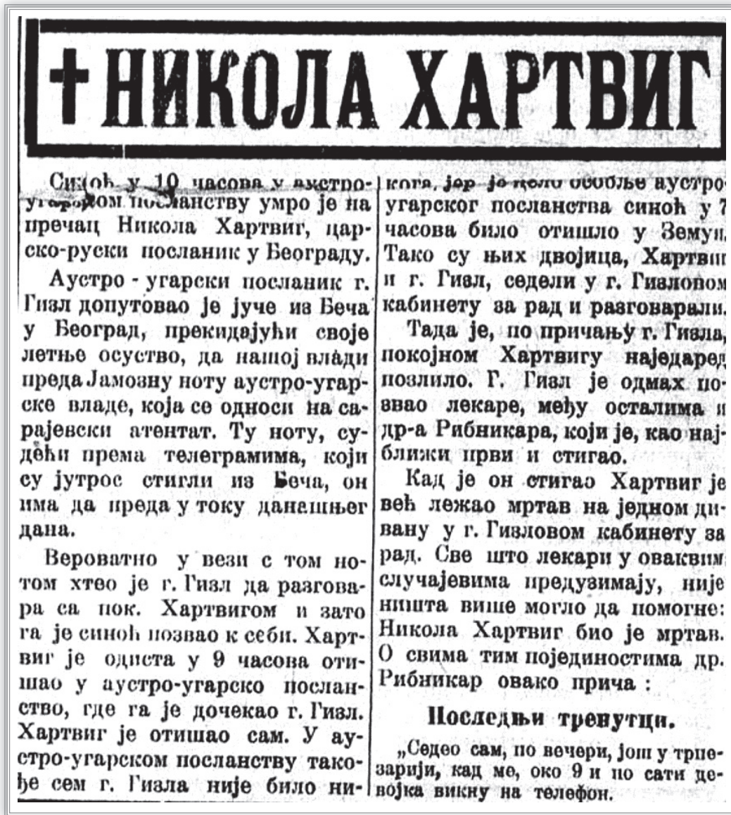
Некролог Н. Г. Гартвигу в периодической печати

Гартвига, которого обожали сербы, оплакивал весь Белград.