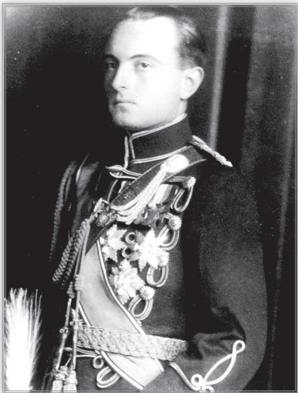
Павел Карагеорѓиевич (Павле Карађорђевић, 1893–1976), князь, регент Югославии (1934–1941). 1930-е гг.

Уехал на белом коне последний пра- витель Сербии.