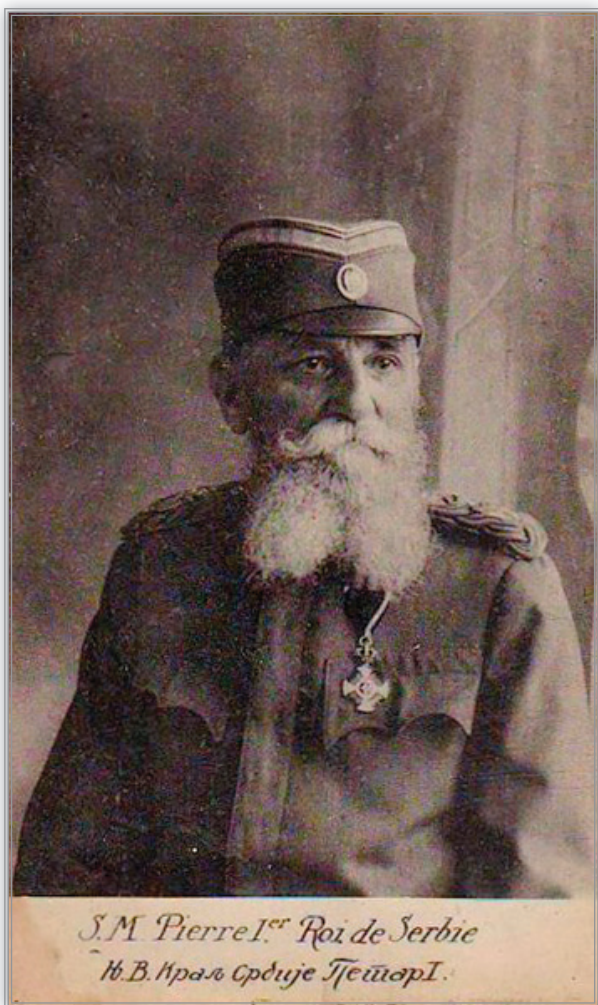
Петр I Карагеоргиевич (Петар I Карађорђевић, 1844–1921), первый сербский король из династии Карагеоргиевичей (с 1903), с 1918-го король сербов, хорватов и словенцев

А прежде чем въехать на белом коне на улицы Белграда, дядя Петя (чика Пера), как назовет его народ, успеет повоевать.