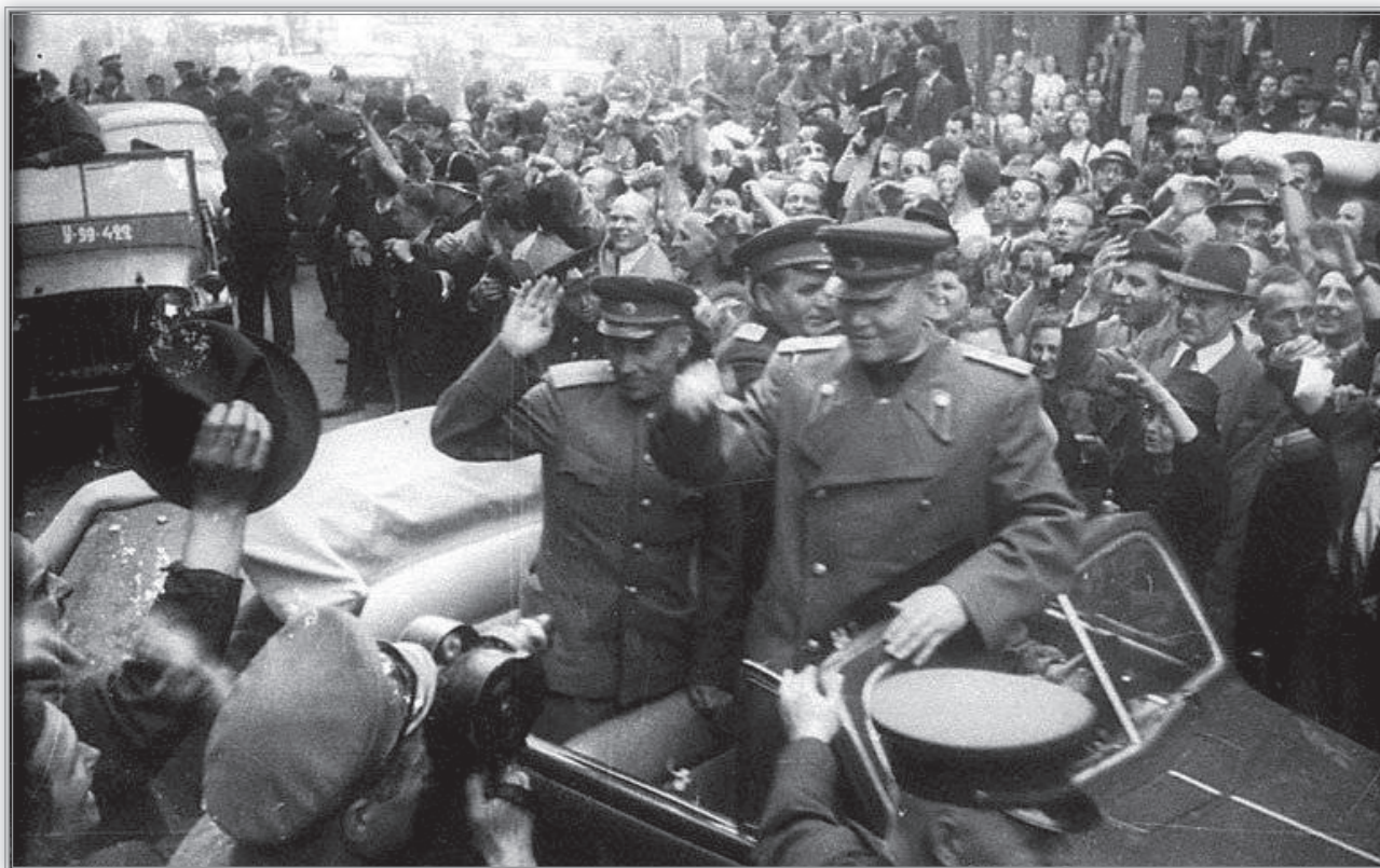
Жители Праги встречают маршала Советского Союза И. С. Конева

9 мая в Прагу вошла армия маршала Конева. До 12 мая шли бои. Во время так называемой Пражской операции погибли 11 997 советских солдат. А Конева сделали почетным гражданином Праги.