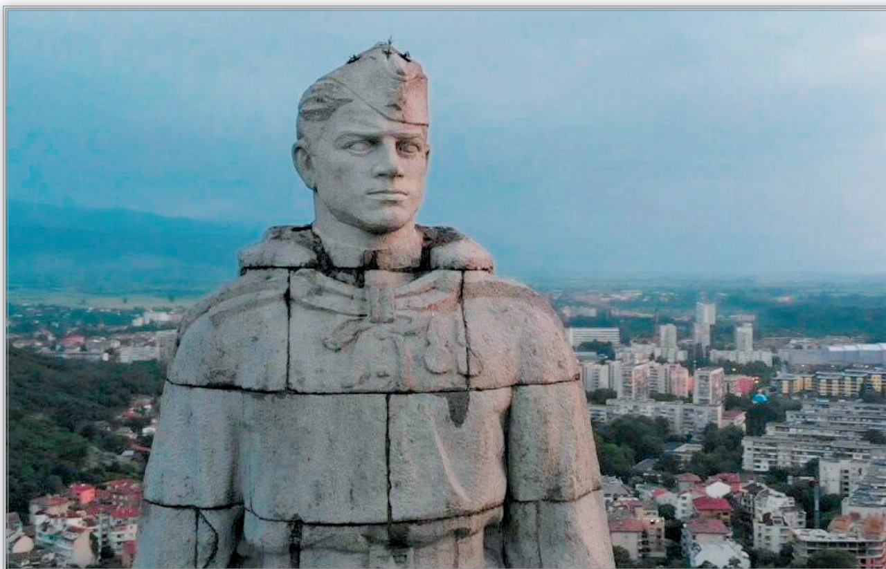
«Алеша» в Пловдиве (фрагмент). Скульпторы В. Радославов, Л. Далчев, Т. Босилков, А. Ковачев. Архитекторы Н. Марангозов и др. 1957

в наших лагерях венгры были в 1945 г. на третьем месте после немцев и японцев. Забыть, что Польша была прямой соучастницей Гитлера наряду с Румынией в территориальных захватах после Мюнхенского стовора 1938 г., а вовсе не невинной жертвой в развязывании Второй мировой войны. Идеологи советской эпохи из соображений пролетарского интернационализма не позволили эти факты запускать в исторический оборот.