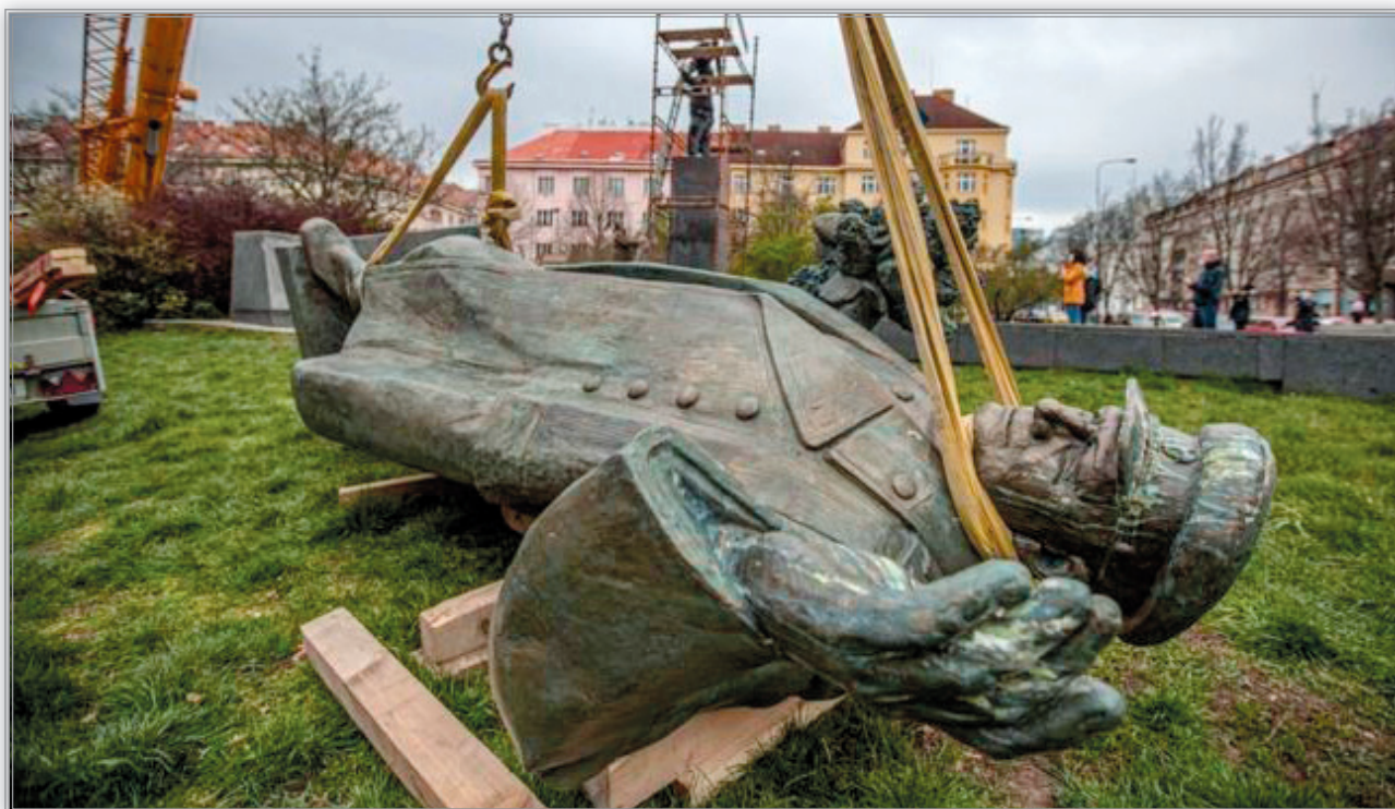
Сброшенный с пьедестала памятник И. С. Коневу

возможность интеллектуальной работы изгнанникам из революционной России. Стране, где в 1968 г. была Пражская весна, когда советские интеллигенты шутили, играя русскими языковыми ассоциациями с фамилиями чехословацких политиков: «Слыхали новость? Когда Новотный дал Дубчека, в Чехословакии настала свобода, но Советы сделали ей Билак, закрутили Гаек, и жизнь в стране превратилась в Черник». А когда Советский Союз ввел в Прагу танки, все повторяли строчки Евтушенко: «Танки идут по Праге, // Танки идут по правде».