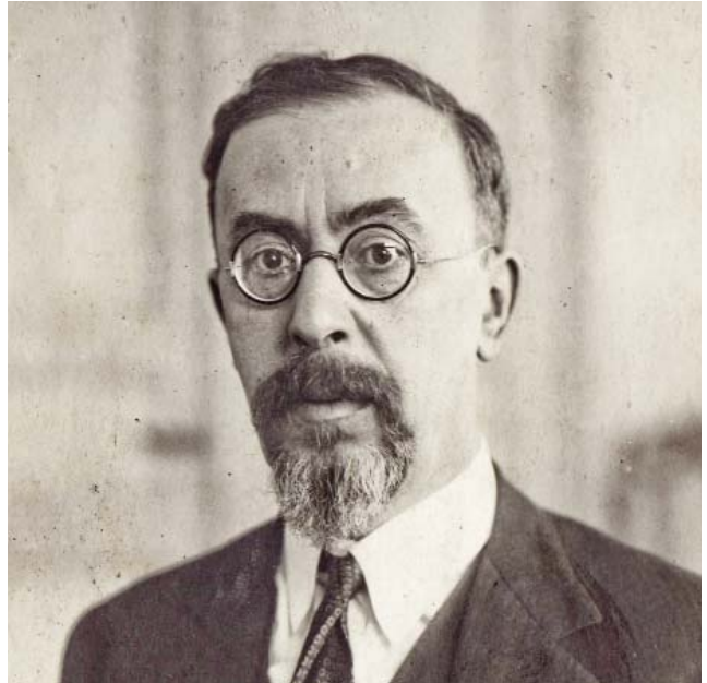
Семен Львович Франк (1877–1950)

5) Религ<иозная> философия. Своеобразн<ая> связь космоса и человека. Космич<еский> характер. Богородица и мать сыра земля 5 . Тютчев.