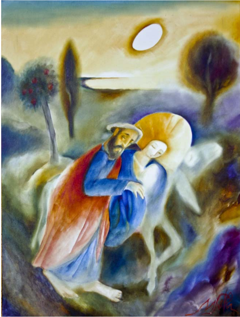
Бегство в Египет