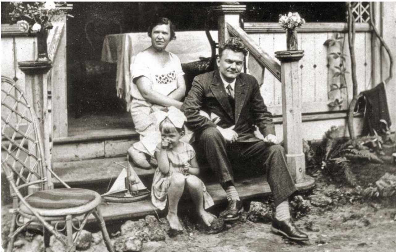
Я. Э. Стэн на крыльце родного дома рядом с родственниками. 1925 или 1928

ношение к нему, определяемое идеологическими причинами. И здесь дело не сводится к рецензиям на индивидуальные монографии. Есть рецензии на сборники, и есть рецензии на периодические издания. В них также содержатся оценки нужного лица, но их надо выявить. Газетные статьи могут иметь решающее значение для реконструкции событий идейной жизни. Насколько они влияют на текущий момент, настолько же их значение исчезает в потоке времени. Причем следует учитывать как философские статьи в массовых газетах с их резонансностью, так и многотиражки вузов и академических структур, содержащие богатые сведения, включая иконографические.