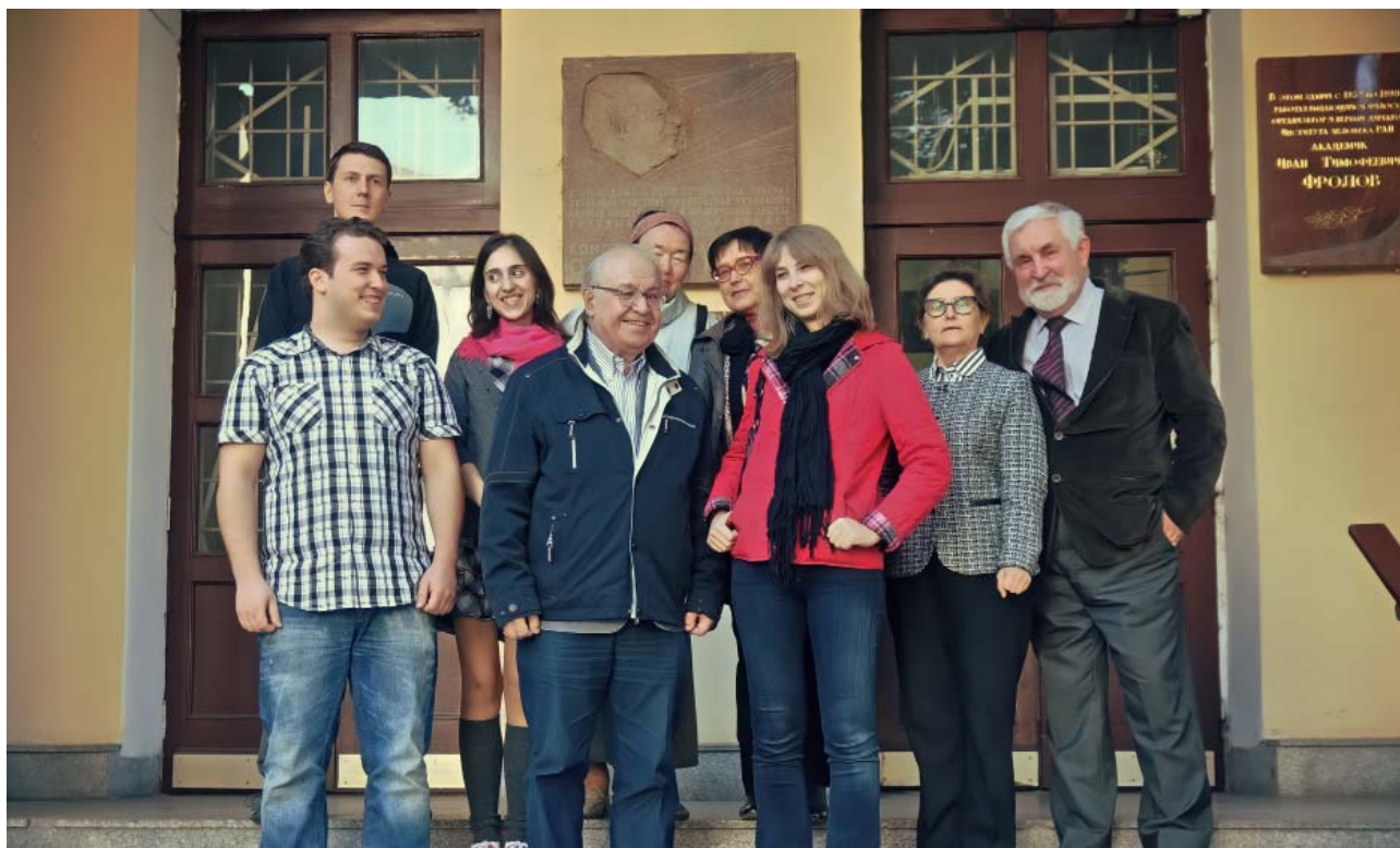
Сотрудники сектора теории познания ИФ РАН у входа в институт

практической пользы, как и от высокого искусства: оперы, балета, симфонической музыки, живописи, серьезной художественной литературы.