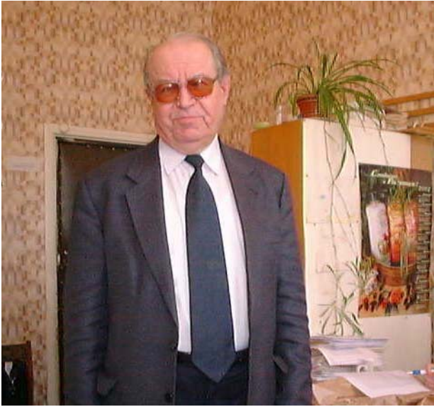
В. А. Лекторский в редакции журнала «Вопросы философии». 2005

философии. Но вот что касается основных идей, например моей книги «Субъект, объект, познание» (1980), то от них я не отказываюсь, хотя, как мне кажется, понимаю и развиваю их лучше, чем делал это раньше.