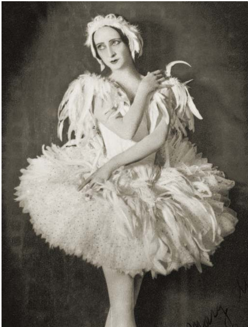
О. А. Спесивцева в костюме к балету П. И. Чайковского «Лебединое озеро». 1934. Сидней

Такая «хореографическая словесность» Волынского в жанровом и стилевом отношении противостояла балетной критике того времени, ее «сухой рецензионной прозе».