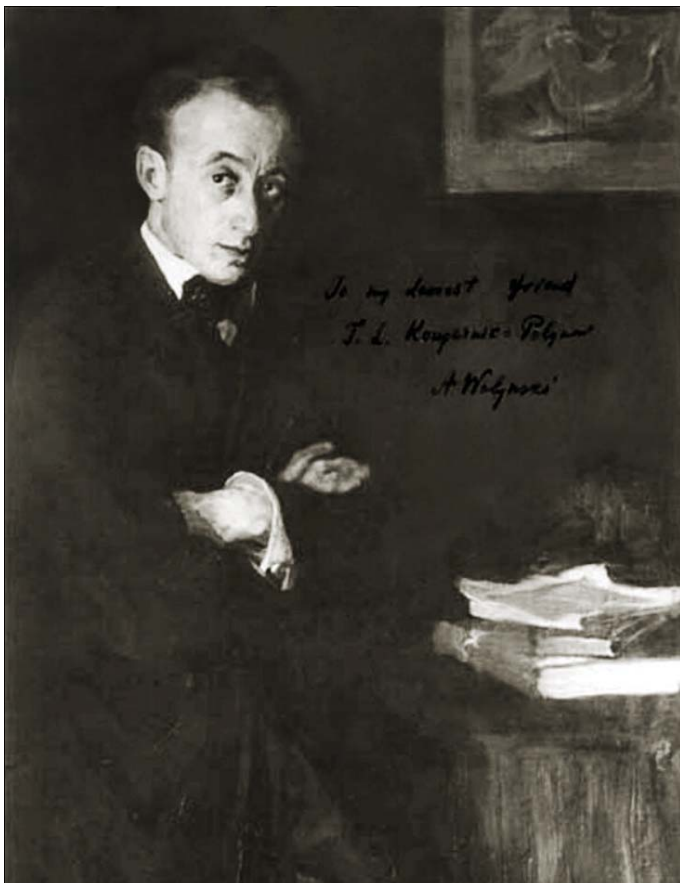
С. Сорин. Портрет философа. 1905. Фото с портрета Акима Львовича Волынского

ных сил балету, создав настоящую философию танца. Этому делу он посвятил 360 статей, написанных с 1910 по 1924 год, «Книгу ликований»; более того — он создал в Петрограде Школу русского балета и преподавал в ней.