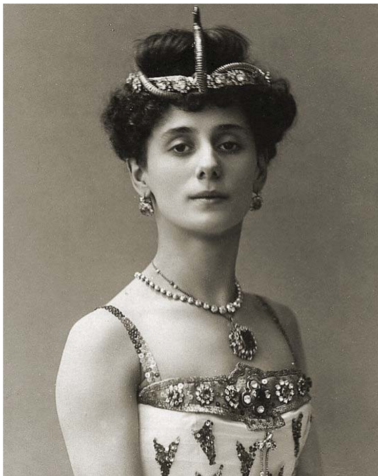
А. П. Павлова в костюме принцессы Аспиччи к балету Ц. Пуни «Дочь фараона». 1910

который описан в платоновском «Пире», в эпоптической иерархии: любовь к прекрасному телу; любовь к прекрасному в телах вообще; любовь к душе, ее проявлениям и «образам»; любовь к самому знанию всего этого и, наконец, любовь к чистой идее, Ἔρως τῆς ιδέας.