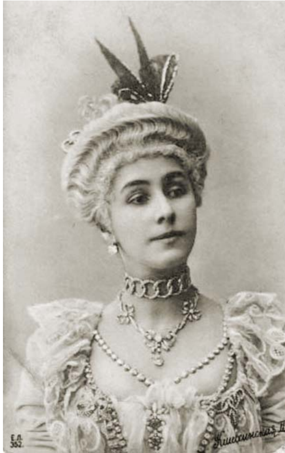
М. Ф. Кшесинская в costume к балету Л. Минкуса «Камарго». Ок. 1902

содержащий при этом терминологически точные характеристики техники танца и работы балетмейстера. Кроме того, Волынский указывал на метафизическое значение танца: в философских понятиях он раскрывал смыслы движений и состояний танцующего тела.