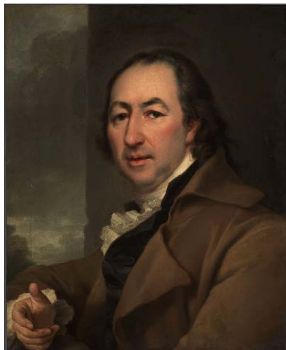
Дмитрий Левицкий. Портрет Николая Ивановича Новикова. 1797