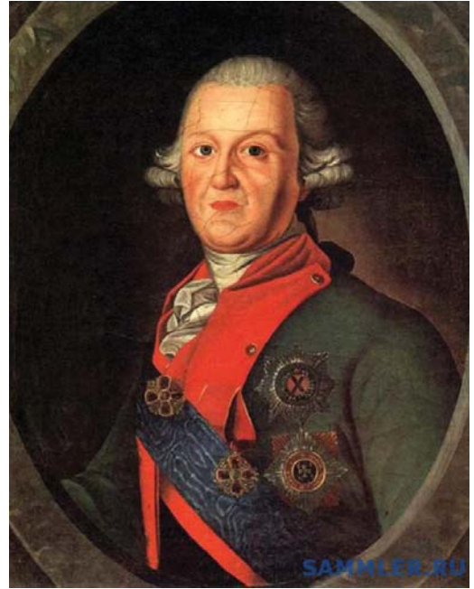
Неизвестный художник. Портрет Петра Дмитриевича Еропкина. 2-я половина XVIII века. Тульский музей изобразительных искусств

триевичем Еропкиным (1724–1805) команда солдат с подьячими, народ ей не подчинился. Пронесся вопль: «Богородицу грабят, бейте их», ударили в набат, и народ ринулся в Кремль убивать Амвросия. Толпа разорила Архиерейский дом, начала грабить Чудов монастырь, где добралась до винного погреба. Искали архиепископа, но тот уехал в Донской монастырь. Утром следующего дня толпа была у стен обители. Амвросий вышел, попытался увещевать людей, но был растерзан бунтовщиками. Оголтелая орава требовала уже голову самого Еропкина. Генерал сначала приказал стрелять холостыми, но в толпе решили, что, раз нет убитых, значит, их охраняет Богородица, и ринулись в наступление. В последний момент на помощь защитникам Кремля успел