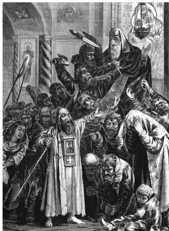
И. И. Матюшин. Убиение высокопреосвященного Амвросия во время московской чумы. 1872. Гравюра

В Россию эпидемия чумы в те годы проникла через территории Молдавии и Украины. Пик эпи-