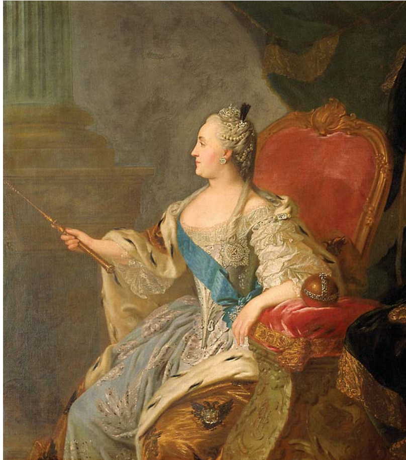
Ф. С. Рокотов. Портрет Екатерины II. 1763. ГТГ

и архимандриты, сколь и доминиканцы, прибудет в Москву, на голос родившейся в Германии принцессы, и что она соберет у себя в большом зале идолопоклонников, мусульман, греков, латинян, лютеран, которые все станут ее детьми.