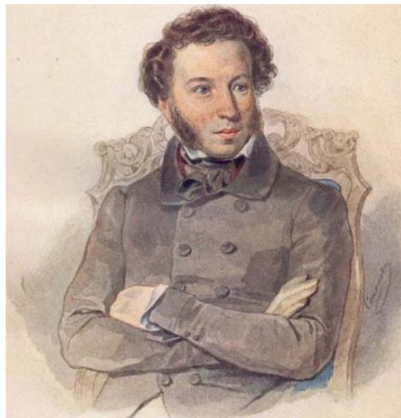
П. Ф. Соколов. Портрет А. С. Пушкина. 1836. Всероссийский музей А. С. Пушкина, Санкт-Петербург

ней мере, встать с ним вровень. Кстати, крестьяне примкнули к мятежу только на втором году бунта. Интересно, что среди бесконечных убийств, совершенных Пугачевым, чуть не погиб великий баснописец. Его отец возглавлял защиту Оренбурга. Как пишет Пушкин, «Пугачев скрежетал. Он поклялся повесить не только Симонова и Крылова, но и все семейство последнего, находившееся в то время в Оренбурге. Таким образом обречен был смерти и четырехлетний ребенок, впоследствии славный Крылов» [Пушкин, 1959–1962, т. 7, с. 58]. Реально бунту сопротивлялось дворянство: «...стало ясно, что при всех издержках лишь дворянство могло быть истинной опорой трона» [Анисимов, Каменский, 1994, с. 168].