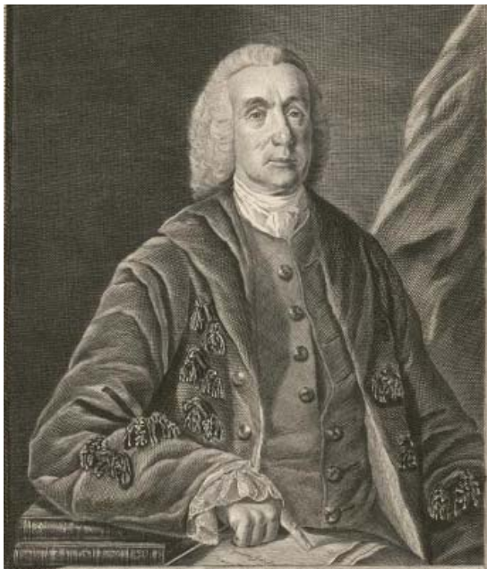
Д. Г. Герасимов. Портрет Т. Димсдейла. 1769. Офорт. ГММИ имени А. С. Пушкина

к России Крым, подписала Георгиевский трактат о протекторате России над Грузией, пригласила скульптора Фальконе, создавшего памятник Петру Великому в Петербурге, дала жалованные грамоты дворянству и городам, победила в войне Швецию и совершила еще множество дел на благо Российского государства. Особой строкой стоит отметить, что справилась в России с оспой, самой страшной заразой после чумы, введя оспопрививание.