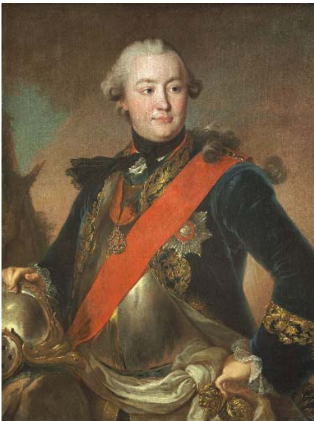
Ф. С. Рокотов. Портрет графа Г. Г. Орлова в латах. 1762–1763. ГТГ

Великолуцкий полк, прямо с марша ударивший по бунтовщикам. Имевших огнестрельные ранения горожан солдаты считали преступниками и добивали, а звонарей, бивших в колокола для разжигания бунта, штыками сбрасывали с колоколен.