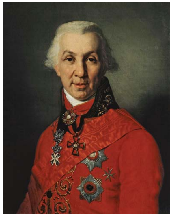
В. Л. Боровиковский. Портрет Г. Р. Державина. 1811. Всероссийский музей А. С. Пушкина, Санкт-Петербург

Державину не удалось захватить самозванца. Екатерина направила в итоге для борьбы с бунтом серьезных полководцев, имевших большой боевой опыт, — это А. И. Бибиков, граф П. И. Панин и наиболее результативный эстляндский дворянин полководец И. И. Михельсон. Даже А. В. Суворов бы снят с турецкого фронта и послан против Пугачева. Императрица долго медлила с отправкой Суворова, поскольку не хотела, чтобы Запад понял, сколь серьезен и опасен для российского государства этот бунт. Разбил Пугачева и пленил его Михельсон. Я. К. Грот так описывает, опираясь на «Записки» Державина, его встречу с Пугачевым: