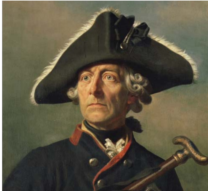
Вильгельм Кампхаузен. Портрет Короля Пруссии Фридриха II. 1870. Дворец Сан-Суси, Потсдам

кончилась буквально ничем. Ломоносов писал в Оде на восшествие на престол Екатерины: «Слышал ли кто из в свет рожденных, / Чтоб торжествующий народ / Предался в руки побежденных? / О стыд, о странный оборот!» [Ломоносов, 1986, с. 170].