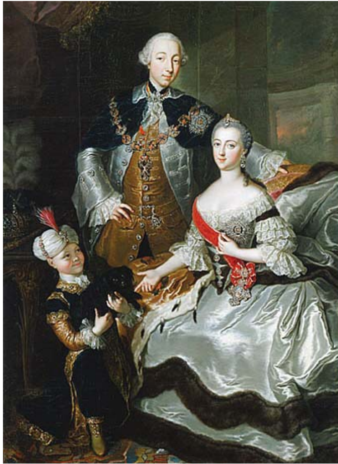
Анна Розина де Гаск. Великая княгиня Екатерина Алексеевна с супругом Петром III Федоровичем. 1756. Национальный музей Швеции, Стокгольм

В 1758 году Пруссия была завоевана русскими войсками в результате Семилетней войны. Кенигсберг стал русским городом, и немецкий философ Кант написал письмо императрице Елизавете Петровне: