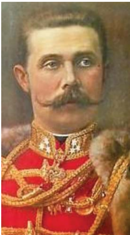
Барон де Тотт

демии пришелся на период с июля по ноябрь 1771 года. Ежедневно умирало более тысячи человек. Трупы умерших выбрасывались на улицу или тайно зарывались в садах, огородах и подвалах. Поводом для восстания послужил инцидент у Варварских ворот Китай-города. В народе распространялось поверье в чудотворность иконы Боголюбской Божией Матери, в то, что она может исцелить от «моровой язвы». Толпы народа стали стекаться к Варварским воротам. Московский архиепископ Амвросий, понимая, что скопление народа способствует распространению заразы, не разрешил там молебны.