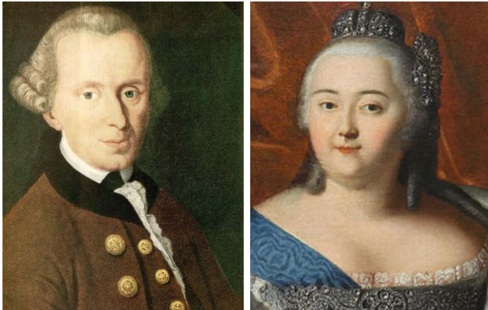
Иммануил Кант и Елизавета Петровна

Импер. Величества оказывать наукам высочайшее покровительство и благосклонное попечительство побуждают меня верноподданнейше просить Ваше Имп. Величество соблаговолить милостиво определить меня на вакантный пост ординарного профессора, уповая на то, что академический сенат в рассуждении наличия у меня необходимых к сему способностей сопроводит мою верноподданнейшую просьбу благоприятными свидетельствами. Умолкаю в глубочайшем унижении,