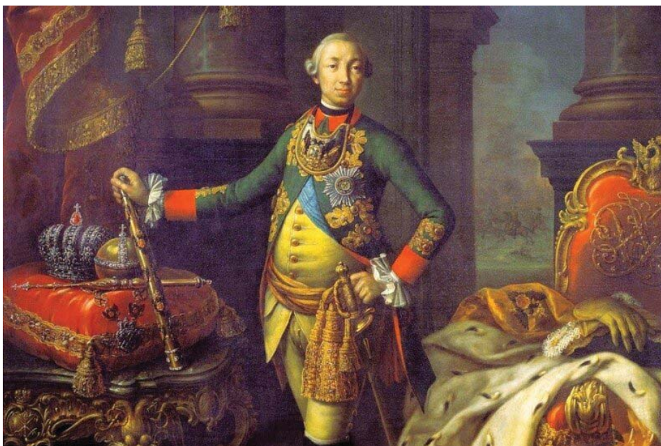
А. П. Антропов. Портрет Петра III. 1762. ГТГ

Известно, что в ночь на 28 июня 1762 года Екатерина II в сопровождении Алексея и Григория Орловых прибыла из Петергофа в Санкт-Петербург в казармы Измайловского полка, где немедленно была провозглашена самодер-