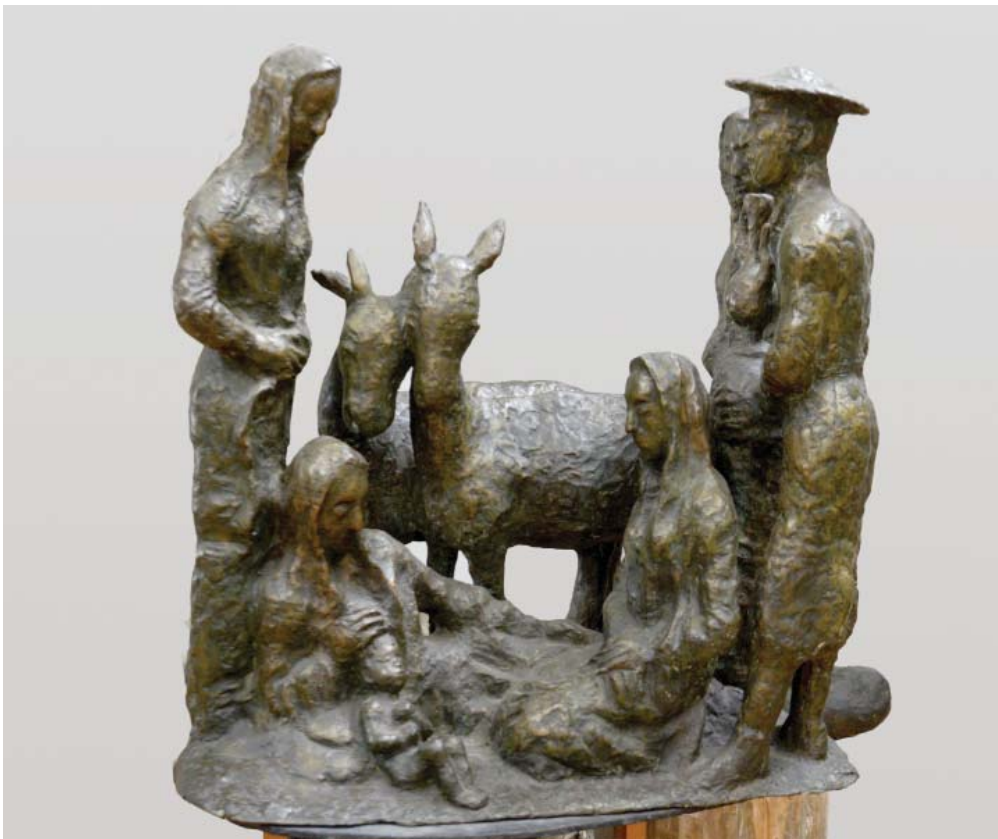
Л. Гадаев. Рождество. Бронза. 2002

Позволим себе отсылку к широкому определению культуры, предложенному М. Л. Гаспаровым: «...это все, что люди делают, говорят и думают», «все, что есть в обществе» [Гаспаров, 2012, с. 125, 77]. Более развернуто данный тезис звучит следующим образом: «Это пища, одежда, жилище, хозяйство, семья, воспитание, образ жизни, нормы поведения, общественные порядки, убеждения, знания, вкусы. Зачем существует культура? Чтобы человек на земле выжил как вид...» [Гаспаров, 2012, с. 18]. Эрудированность известного филолога, переводчика, литературоведа, хорошо знавшего историю культуры от Античности до Серебряного века, подталкивает прислушаться к его мнению. Работы Лазаря Гадаева, как представляется, ведут нас в этом же направлении. Дело не ограничивается тем, что вслед за М. М. Бахтиным (и не только) большое и малое становятся сюжетами скульптурных, графических, живописных произ-