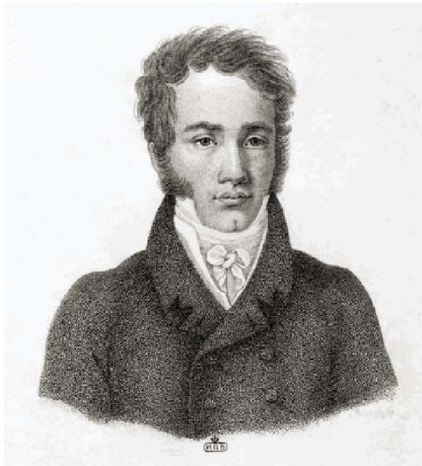
А. С. Стурдза в молодости

вновь обратиться к вопросу о том, какие меры позволят предотвратить антиправительственные восстания в будущем. Одним из ключевых разработчиков подобных мер в России был А. С. Стурдза.