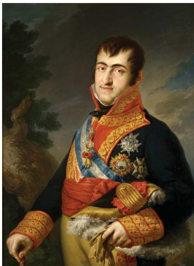
В. Лопес Портанья. Портрет Фердинанда VII. 1814–1815

В первой записке (отправлена 24 апреля 1820 года) он обращается