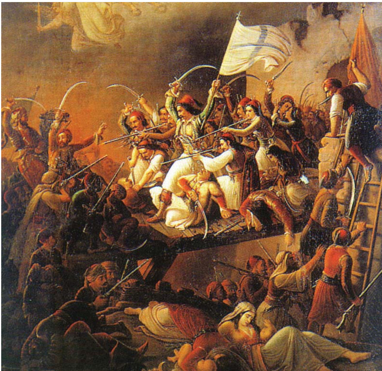
Т. Вризакис. Эксодос Месолонгиона (Вылазка на Миссолонги). 1853

Позже, в мае 1821 года, Стурдза подготовил обширную записку « Coup d'œil sur l'Orient » («Взгляд на Восток»), в которой еще раз попытался оправдать греков и побудить императора Александра оказать вооруженную поддержку восставшим. В этой записке автор вновь заявляет, что, во-первых, христиане, проживавшие в Османской империи, не являются подданными султана, поскольку «власть, которая их угнетает, не требует от них клятвы верности (...) они никогда не присягали (султану. — А. Ч.)» (АВПРИ. Ф. 133. Оп. 468. Ед. хр. 10233. Л. 13). Во-вторых, христианское население Османской империи не имело никаких прав, а значит, султан не имеет права требовать от них исполнения каких-либо обязанностей. Даже судебную власть над греками, по утверждению