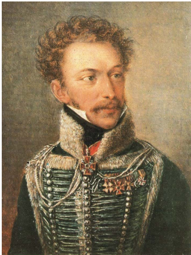
А. К. Ипсиланти. 1814–1817

22 февраля (6 марта) 1821 года отряд генерала русской армии, грека по происхождению А. К. Ипсиланти вторгся на территорию Дунайских княжеств. Через два дня в Яссах Ипсиланти призвал греков к восстанию против осман. Менее чем через месяц вспыхнуло восстание в Морее (на Пелопоннесе). Так началась Греческая революция (1821–1829). Из Ясс Ипсиланти направил Александру I и И. А. Каподистрии письма, в которых просил поддержать дело освобождения греков, ссылаясь на то, что со времен Екатерины Великой Россия стала защитницей православных подданных султана [Арш,