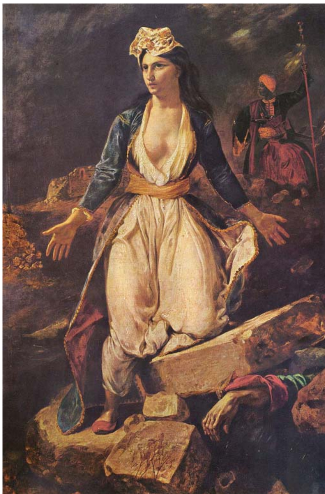
Э. Делакруа. Греция на руинах Месолонгиона. 1826

1994, р. 26–54; Арш, 1976, с. 225–227]. Все они пытались побудить императора к более активным действиям. Мы не знаем, стали ли сочинения Стурдзы, в которых он оправдывал греческое восстание, достоянием общественности в 1821–1822 годах. Однако можно предположить, что И. А. Каподистрия распространял идеи своего секретаря 1 . Т. К. Прусис выявил, что похожие идеи летом 1821 года высказывал Ф. Булгарин, который представил императору Александру меморандум по греческому вопросу. Автор данного документа утверждал, что греческое восстание коренным образом отличается от других революций, называет его «народной войной» и «сравнивает его с разгромом Золотой Орды Дмитрием Донским и завоеваниями Казани и Астрахани Иваном IV» [Prousis, 1994, р. 36]. В неопубликованной работе, относящейся к 1823 году, С. Ю. Дестунис (грек на русской службе, бывший генеральным консулом в Смирне и покинувший свой пост после начала греческого восстания) настаивал, что