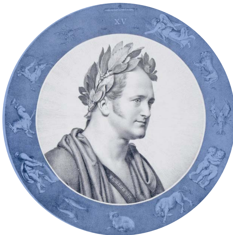
О. А. Кипренский. Портрет Александра I со знаками зодиака. 1825

Александр Скарлатович поступил на службу в Коллегию иностранных дел. В апреле 1812 года адмирал Чичагов был назначен командующим Дунайской армией и способствовал переводу А. С. Стурдзы к себе в канцелярию [Чичагов, 2023, т. 2, с. 171–172]. Туда же был направлен и И. А. Каподистрия, чьим секретарем на долгие годы стал молодой Стурдза. Каподистрия и Стурдза сделали блестящую карьеру в российском дипломатическом ведомстве. В 1814–1815 годах они входили в состав российской делегации на Венском конгрессе. Каподистрия и Стурдза стали первыми читателями и редакторами Акта о Священном союзе [Стурдза, 1864, с. 69; Каподистрия, 1868, с. 201].