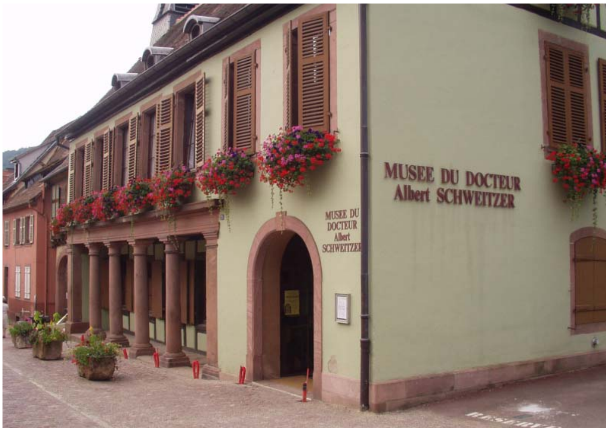
Музей Альберта Швейцера в Кайзерсберге