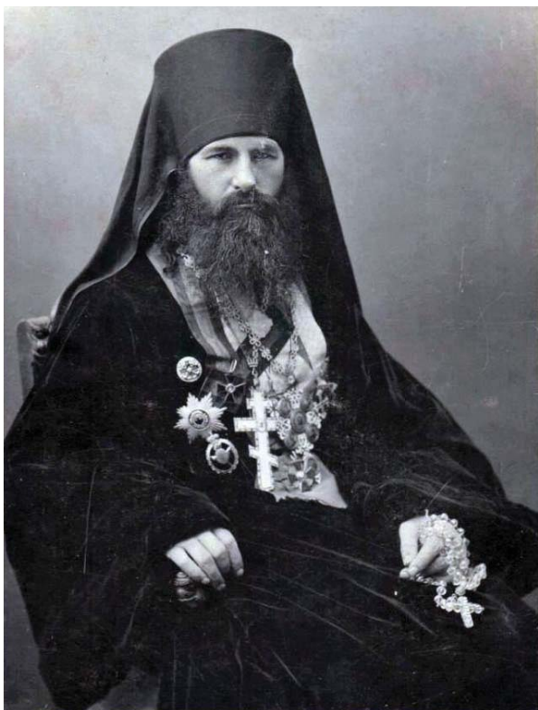
Владимир Соколовский. Фото конца 1890-х

некоторых православных из-за допущения им использования в качестве богослужебного английского языка (что было хорошим миссионерским ходом, привлечшим в русскую церковь американцев) был отозван в Россию [Magocsi, 2005, p. 31].