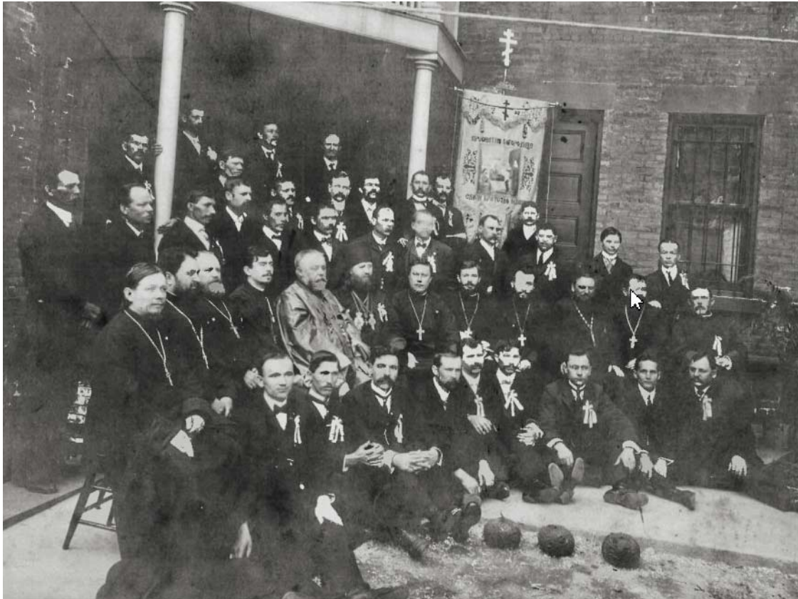
Епископ Тихон (Беллавин) с мирянами и духовенством на собрании членов Братства в честь Рождества Богородицы

1909 году Алексей Товт привел к православной вере более 25 тыс. грекокатоликов из числа представителей русинского меньшинства.