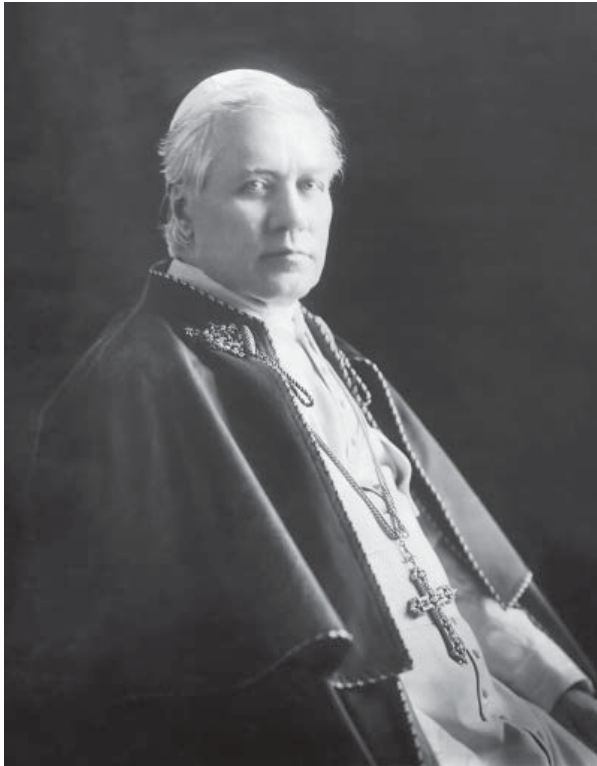
Папа Пий X в 1914 году