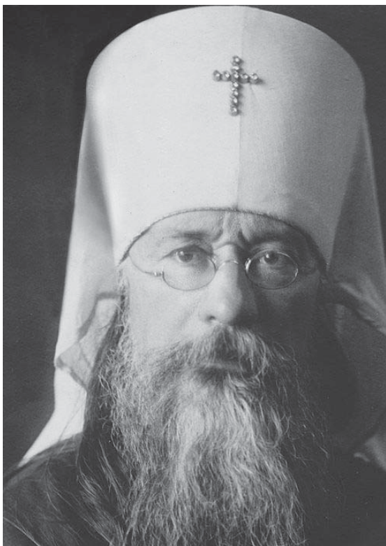
Евлогий (Георгиевский). Фото 1920-х

дело «освобождения угнетенного народа» и «объединения всех земель российского народа в единое государство» [Бахтурина, 2000, с. 58].