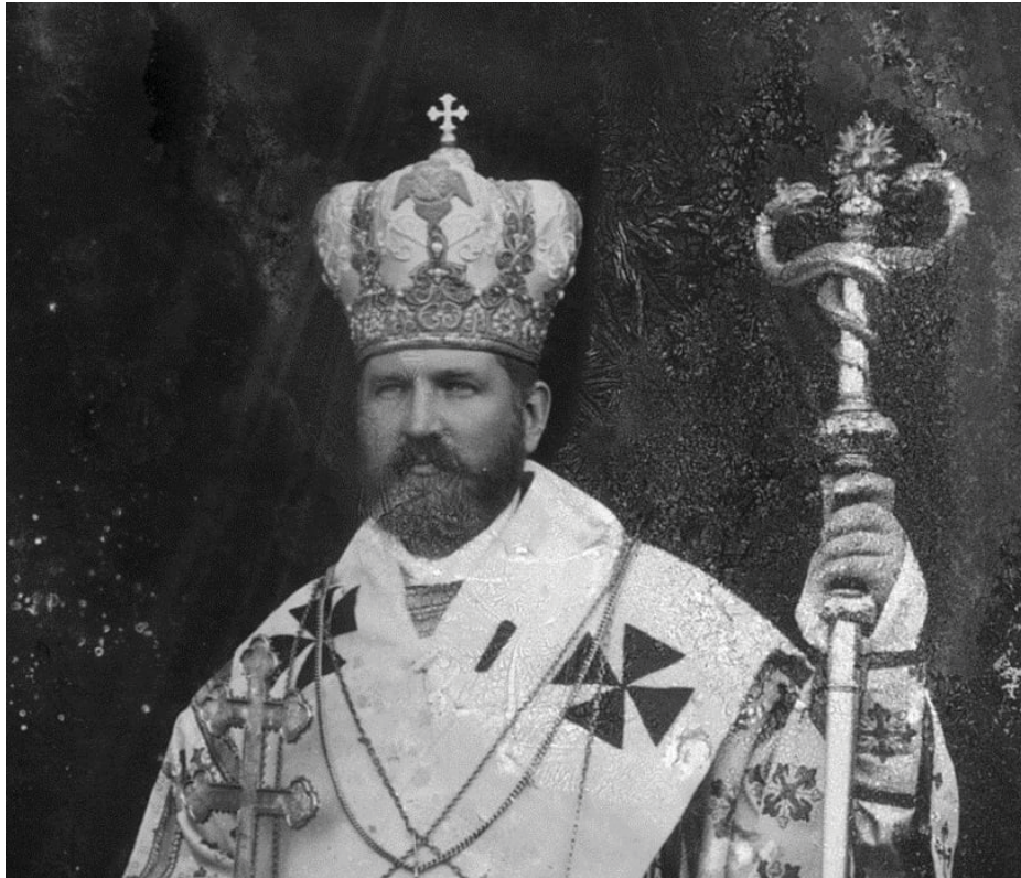
Андрей Шептицкий в полном архиерейском литургическом облачении

с. 134]. Австрийские власти, в свою очередь, жестко реагировали на попытки распространения православия, обвинив в 1912 году двух православных священников в шпионаже в пользу Российской империи [Бахтурина, 2000, с. 138].