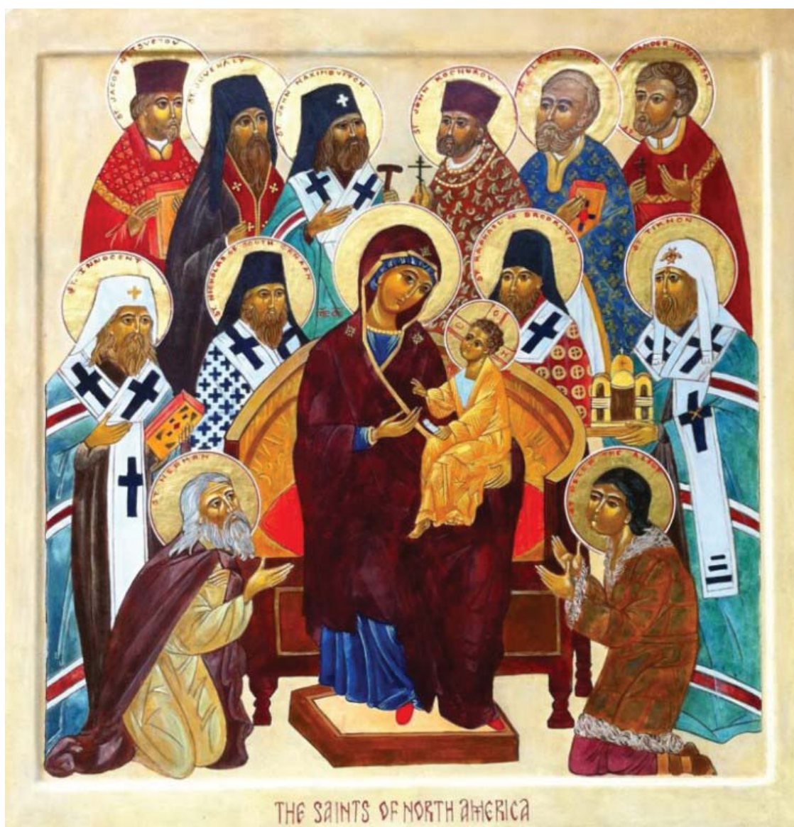
Икона всех святых Северной Америки

Ответными шагами Ватикана стали попытки распространить «униатство» на территорию самой России. Министр иностранных дел Сазонов в письме от 22 июня 1909 года отмечал, что эта инициатива грекокатолического митрополита Андрея Шептицкого находила поддержку в Вене [Бахтурина, 2000, с. 133], но не в Петербурге. Планы Шептицкого об объединении православных с католиками через заключение унии рассматривались российскими властями как «окатоличивание», «полонизация» и даже «мазепинство» [Бахтурина, 2000,