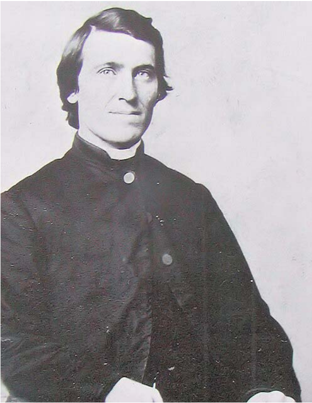
Епископ Джон Айрленд в молодые годы