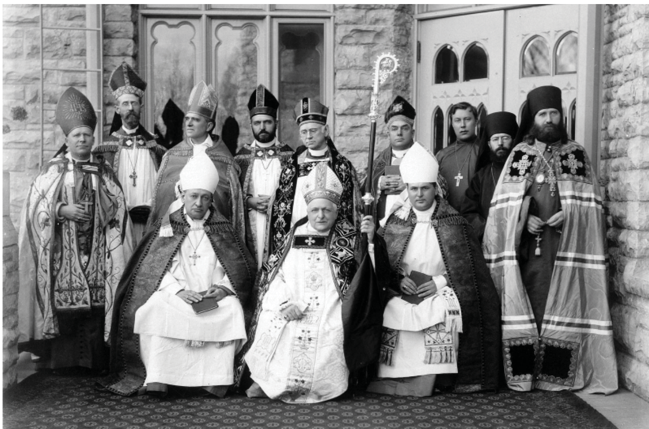
Тихон (Беллавин) на экуменической встрече в Висконсине по случаю рукоположения Регинальда Хебера Вебера в англиканские епископы. 8 ноября 1900

Для Российской церкви и дипломатических представителей Российской империи в США переход талантливого проповедника и богослова Товта стал настоящей удачей, поскольку это открывало возможность для более обширного перехода грекокатоликов Северной Америки в православие и утверждение российских церковных структур в качестве основных на этих территориях. До своей кончины в