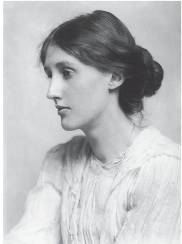
Вирджиния Вулф (1882–1941)

немецкому филологу Эрику Ауэрбаху, который в заключительной главе своей книги «Мимесис. Изображение действительности в западноевропейской литературе» предложил подробный анализ пятой главы первой части романа. В разборе он отметил одну из важнейших черт стиля писательницы — изображение «многосубъектного сознания» [Ауэрбах, 2017, с. 422], при котором повествование постоянно переходит от одного сознания к другому. Не прибегая к термину «поток сознания» (предпочитая ему «внутренний монолог»), Ауэрбах тем не менее весьма наглядно показывает, как Вулф в данном романе использует этот важнейший метод модернистской литературы.